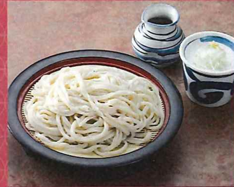
もりうどん 780 円 (税込価格)