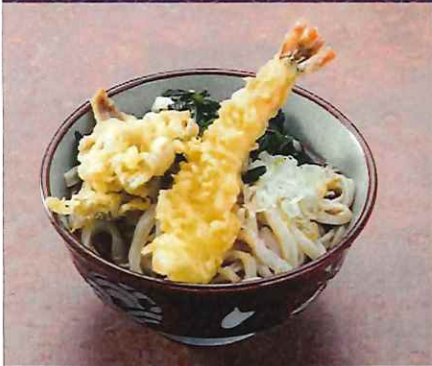
天ぷらうどん 1000 円 (税込価格)