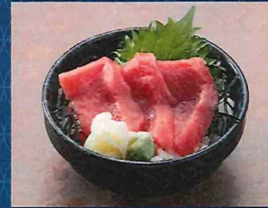
ミニマグロ丼 500 円 (税込価格)