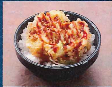
ミニかきあげ天丼 500 円 (税込価格)