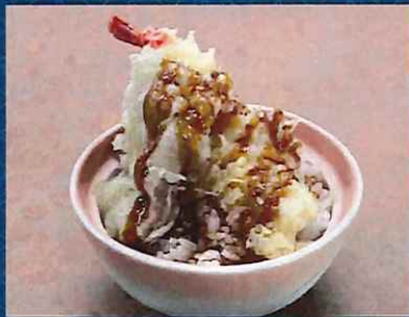
ミニ天丼 500 円 (税込価格)