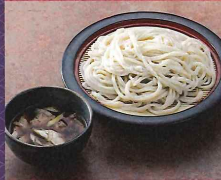
肉つけうどん 950 円 (税込価格)