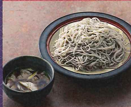
肉つけそば 950 円 (税込価格)