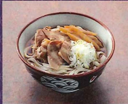
肉うどん 950 円 (税込価格)