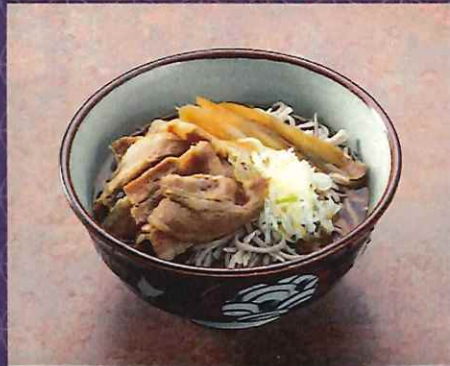
肉そば 950 円 (税込価格)