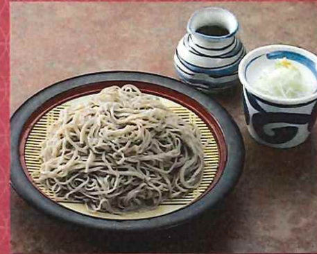
もりそば 780 円 (税込価格)