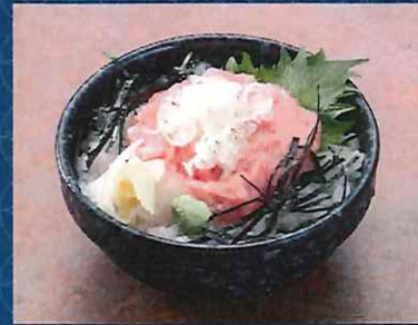
ミニネギトロ丼 500 円 (税込価格)