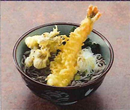
天ぷらそば 1000 円 (税込価格)